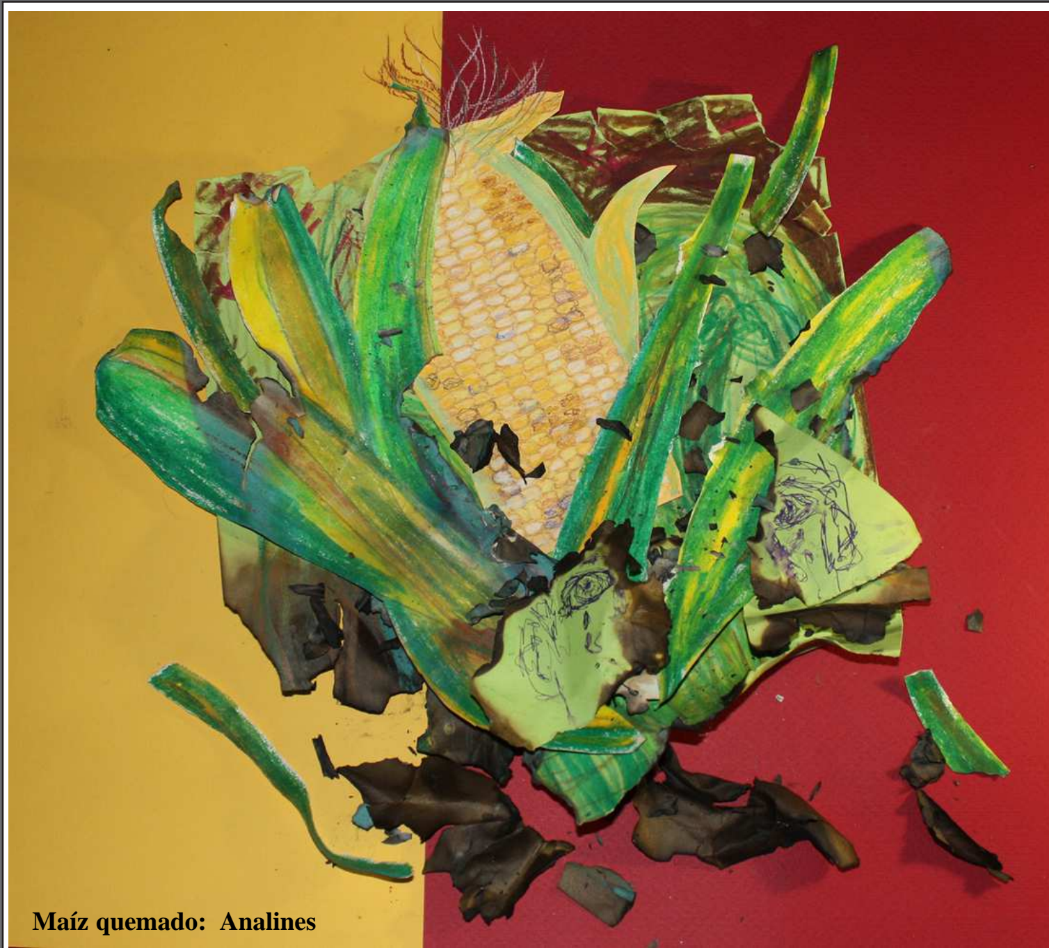
Maíz quemado: Analines