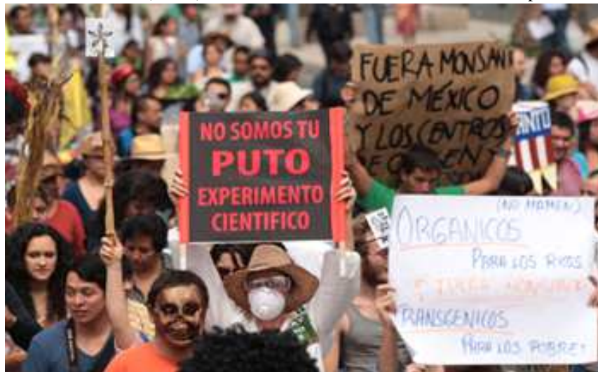
FUERA MONSANTO. No a los OGT. Campaña mundial contra la producción de transgénicos y la complicidad de los gobiernos con la transnacional.

Florestán Fernández (Brasil): reflexiones sobre las revoluciones interrumpidas.